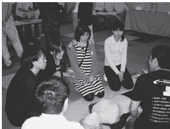
写真3 初めに胸骨圧迫の手技の確認をしました