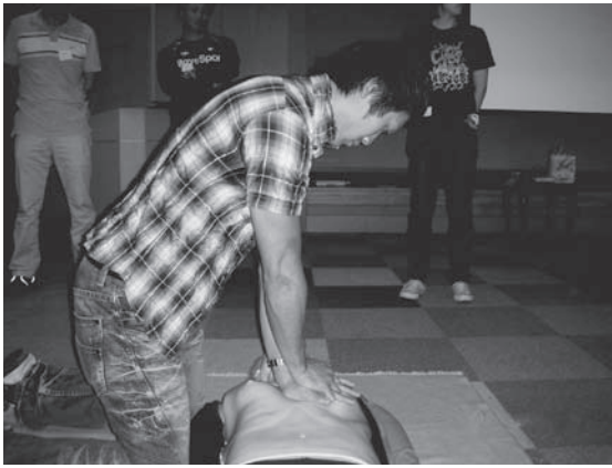
写真4 筆者による胸骨圧迫