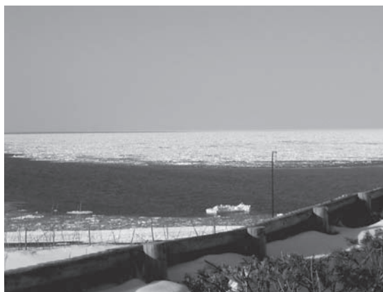
写真2 大浴場から見る流氷

院職員群は看護師(女性10名)保健師(女性1名)放射線技師(男性1名)の合計12名としました。初めに胸骨圧迫の手技の確認をし(写真3)、その後それぞれがレールダル社製レコーディングレサシアン ® の右側に位置して連続1分間の胸骨圧迫を行いました(写真4)。圧迫時の腕の角度を協力者の1名が定位置からデジタルカメラでレサシアン ® の足側から撮影しました。角度の計測方法は、レサシアン ® の乳頭と乳頭を結ぶ線の真ん中を水平線とし、それと直角に交わる直線を基準線としました。基準線に対する角度を分度器にて測定し、その絶対値を腕の角度としています。