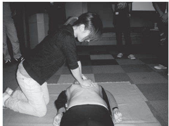
写真5 看護師による胸骨圧迫の例

今回の研究では消防職員であっても鉛直に押せていない人が2人(17%)いました。これは訓練の足りなさが原因です。今一度胸骨圧迫の重要性を確認し、訓練を通し胸骨圧迫の交代のタイミングや、圧迫の深さ、テンポなどを含めて再確認することが必要と思われる。