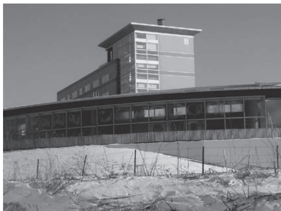
写真1 高台に建つ日の出岬温泉

統計処理にはMann-Whitney U testを用い、 p < 0.05 を有意としました。